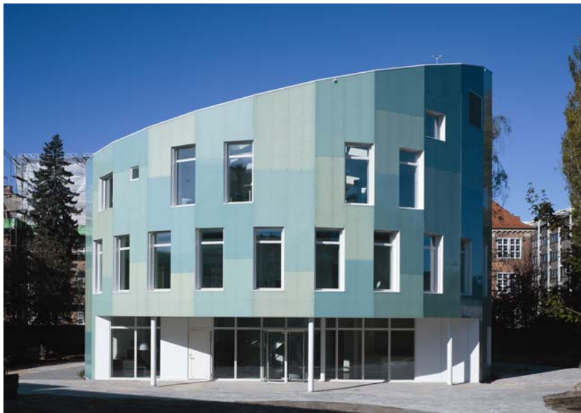
Poslovna građevina Green Lighthouse

Šest će oglednih građevina u realnoj veličini biti izgrađeno do kraja 2010 na lokacijama u Danskoj, Njemačkoj, Francuskoj, Velikoj Britaniji i Austriji. Zatim će se u razdoblju od jedne godine pratiti i bilježiti doživljaji stanovnika s namjerom dobivanja realnih odgovora na planiranu pot-