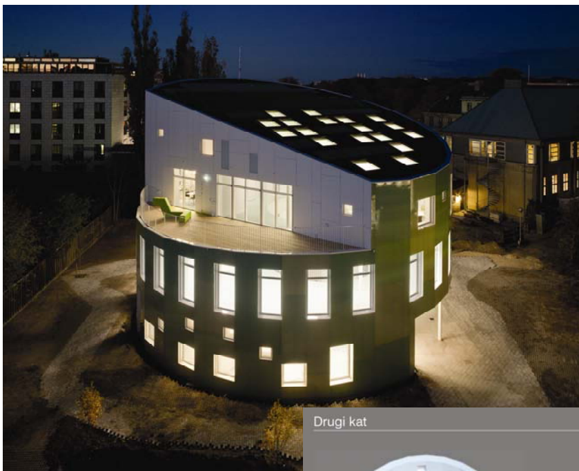
Otvori na krovu zgrade Green Lighthouse

postavljeni u odnosu na orijentaciju, za iskorištavanje prirodnoga prozračivanja i osiguravanja dostatnoga i kvalitetnog osvjetljenja dnevnom svjetlosti. Aktivna je kuća energijski samodostatna, što znači da sama proizvede više energije nego što potroši za svoj rad. Uporaba lokalnih izvora energije i uzimanje u obzir mikrolokacije građevine dovodi do toga da nema emisija CO 2 .