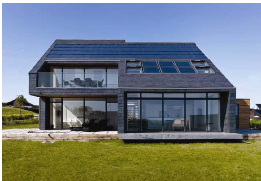
Obiteljska kuća Home for life

Sve su građevine projektirane prema načelu aktivne kuće. Plašt je takvih zgrada dinamičan, sve ugrađene komponente imaju aktivnu ulogu pri iskorištavanju obnovljivih izvora energije, ponajprije energije sunca, koja je iskorištena za pripremu tople vode pomoću solarnih kolektora i za proizvodnju električne struje preko sunčanih ćelija. Prozorski otvori imaju važnu ulogu pri pasivnom grijanju zgrade jer toplinski dobici kroz ostakljene površine smanjuju potrebu za energijom za grijanje. Strateški su